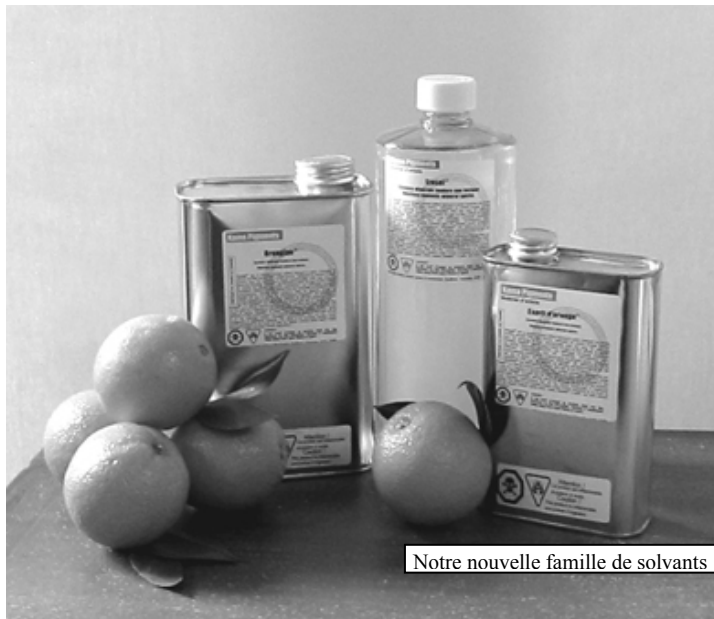
Notre nouvelle famille de solvants