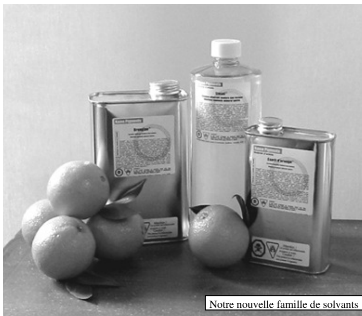
Notre nouvelle famille de solvants